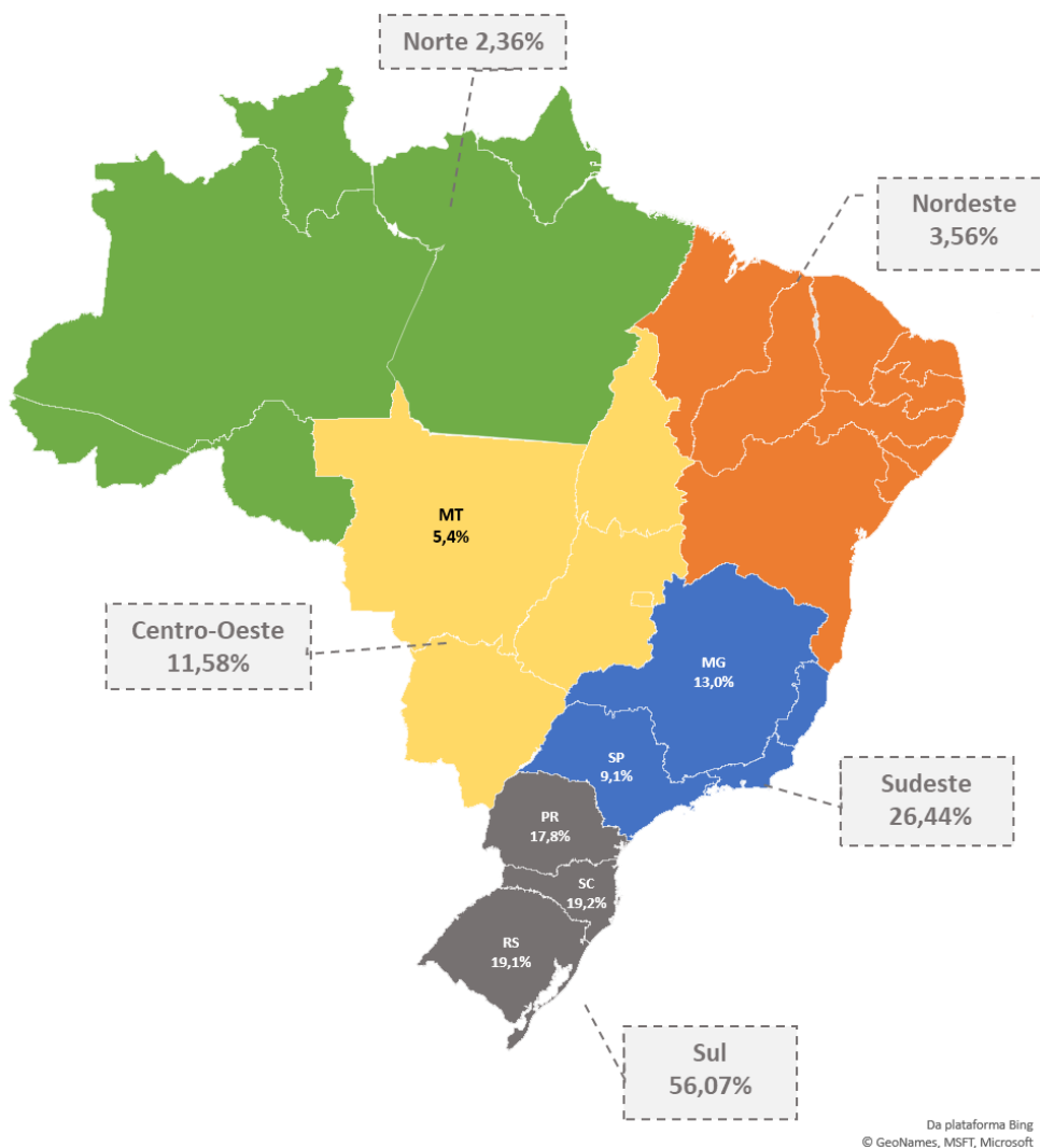
MAPA 1.1 – ASSOCIADOS POR REGIÃO

Destacamos abaixo os estados com representatividade acima de 5% do volume de cooperados e os percentuais por região.